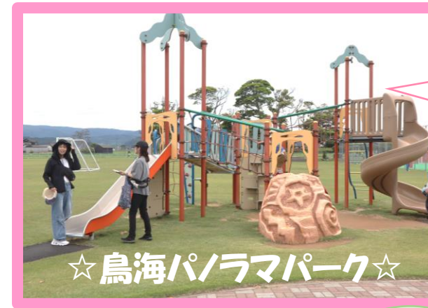
☆鳥海パノラマパーク☆

天気がいいと 鳥海山が キレイに見えるよ! 駐車場が広いので 家族で遊びに行くのも 良さそうです♡