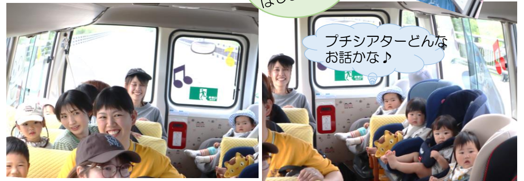
プチシアター~どんな お話かな♪