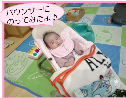
赤ちゃんコーナー★