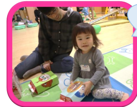
パパと園であそんだよ♪

こども園を開放して遊びました♪ 園に入園していないお友だちはもちろん、他の園に入園しているお友だちもあそびにきてくれましたよ♡