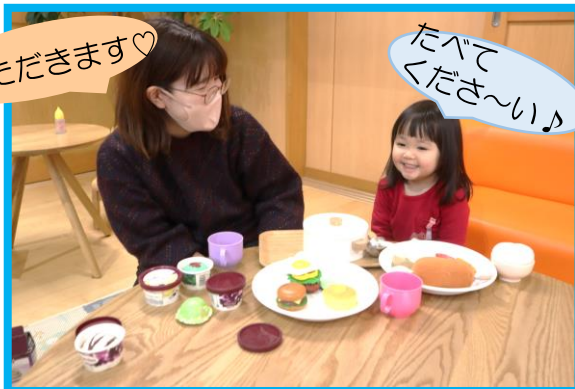
おままごとコーナー♪

こども園ではコーナーあそびを楽しんでいます♪今回はゆうぎしつを中心に遊びのコーナーを準備してあそんでみました♪