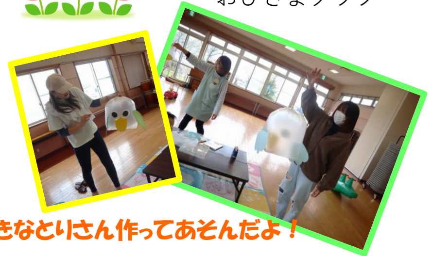
大きなとりさん作ってあそんだよ！

2組のお友だちがあそびにきてくれました♪ 年齢が近いお友だちが集まり楽しい時間を過ごしましたよ。