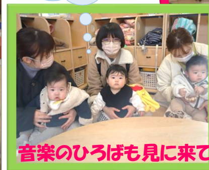
音楽のひろばも見に来てね！