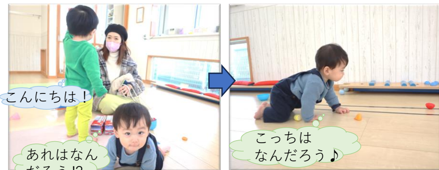
探索活動もたくさんできるよ♪