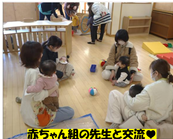
赤ちゃん組の先生と交流♡