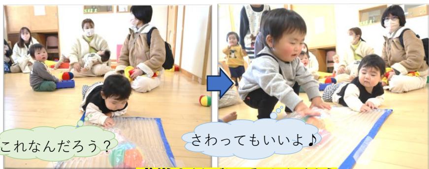
感覚あそびにチャレンジ！

今回のすまいるタイムには、初めてうえだこども園にあそびにきてくれたお友だちがいっぱいでした♡園内を見てみたいということで、すまいるタイム終了後にあそびにしてみました♪