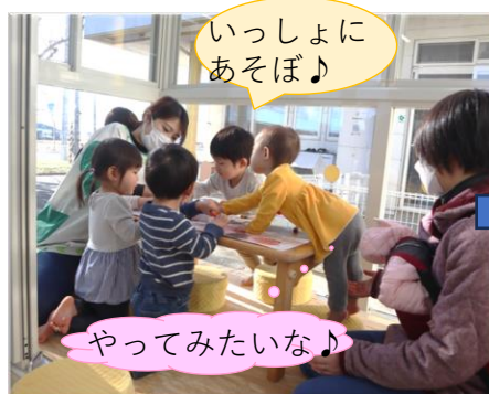
大好きなお絵描きで園児と交流